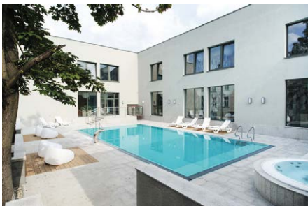
Nowoczesne Atrium z podgrzewanym basenem zewnętrznym i kameralnym Klubem Preludium