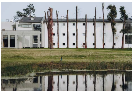
Ekлекtyczny Spichlerz z mini siłownią i bilardem