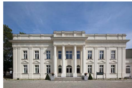
Klimatyczny Belweder z widokiem na park i pokojami w stylu dworskim