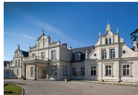
Imponujący Pałac Romantyczny z Lobby Barem, salami konferencyjnymi i strefą SPA